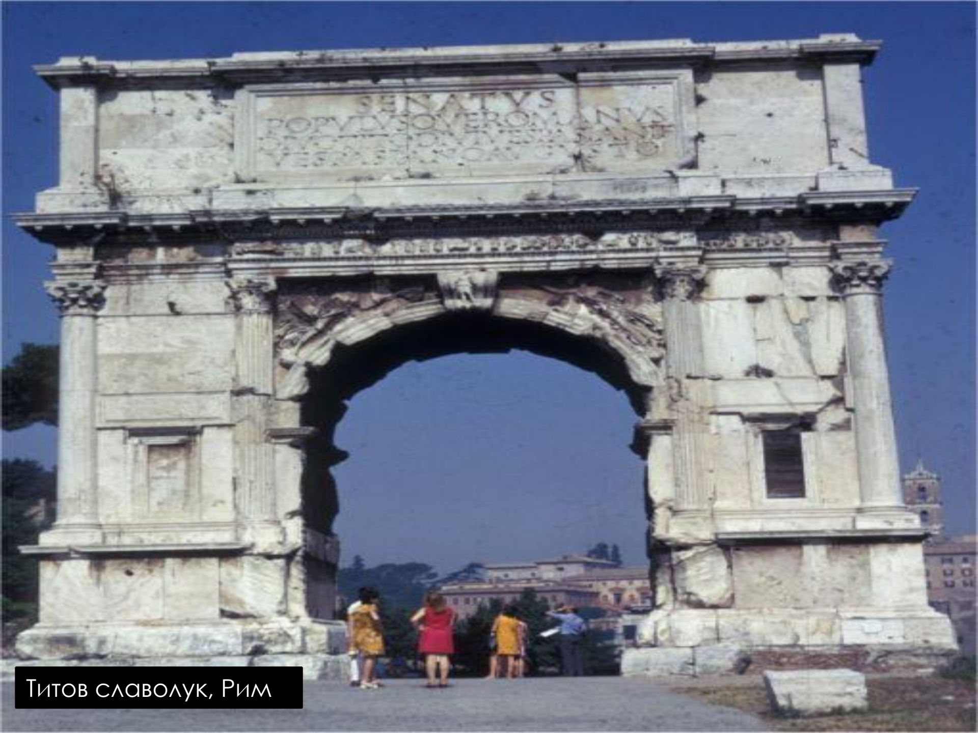
Титов слволук, Рим