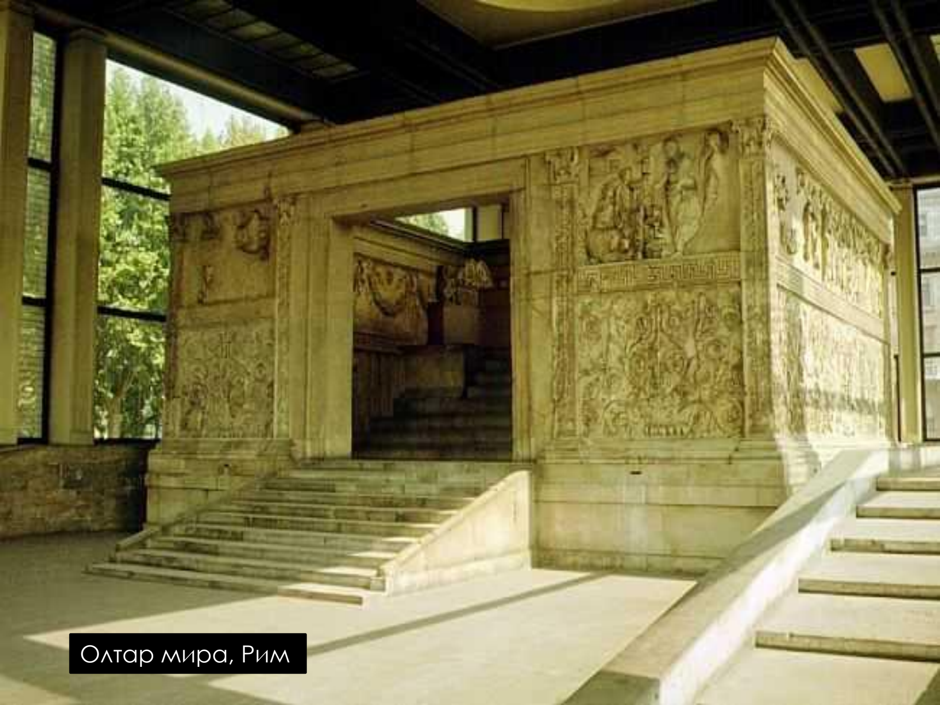
Олтар мира, Рим