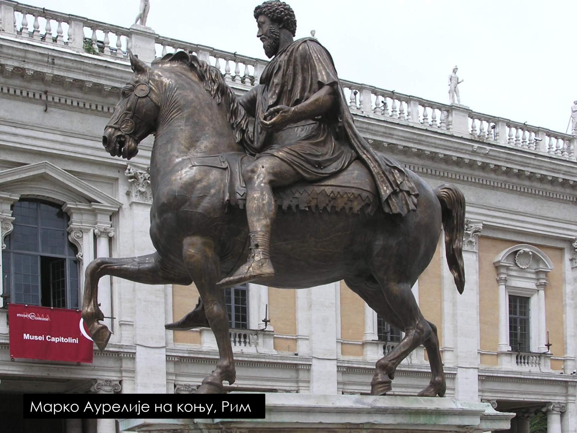
Марко Аурелије на коњу, Рим