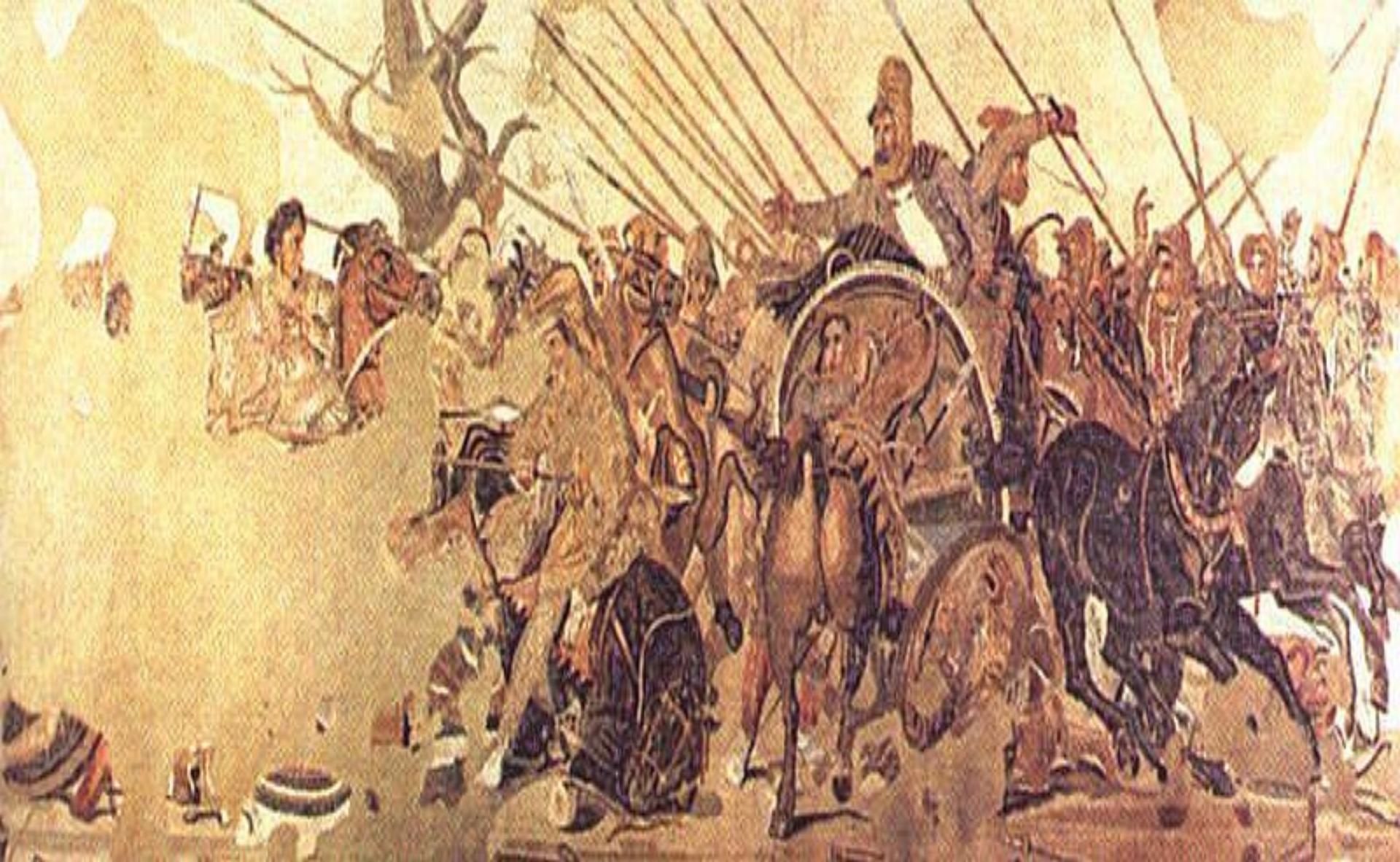
Битка код Иса