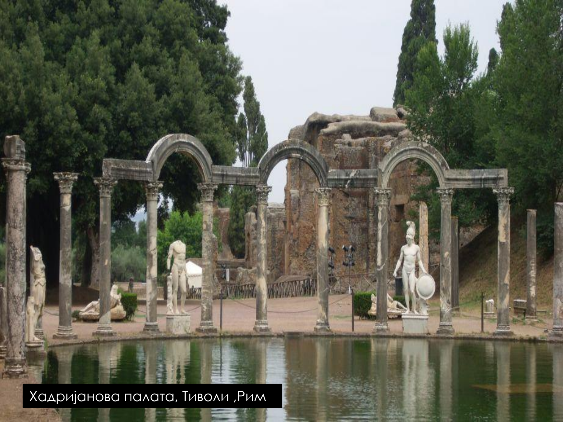
Хадријанова палата, Тиволи ,Рим