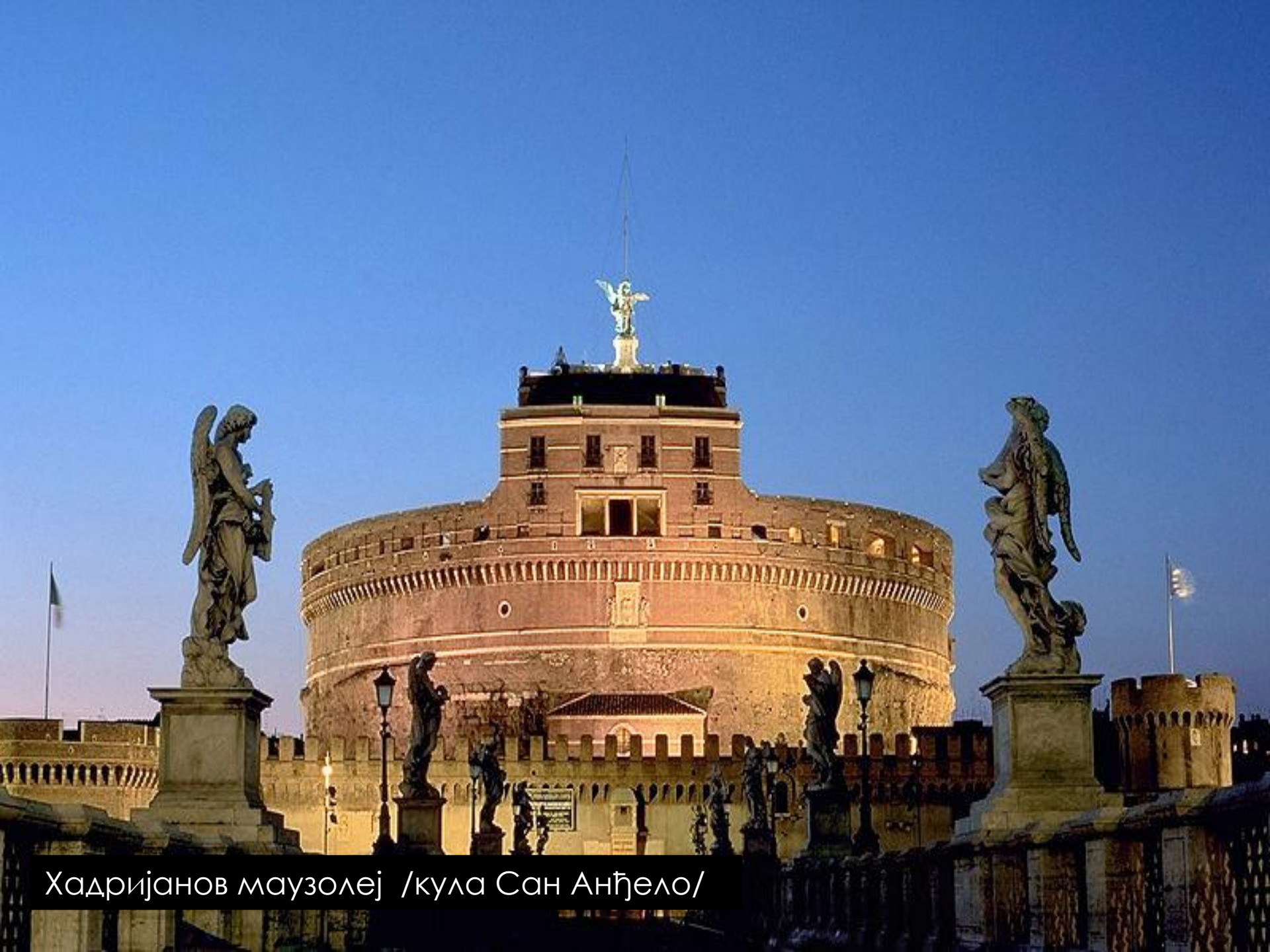
Хадријанов маузолеј /кула Сан Анђело/