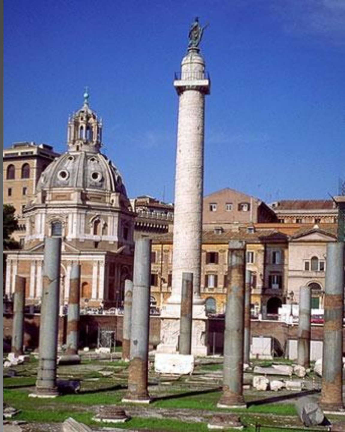
Трајанов стуб, Рим